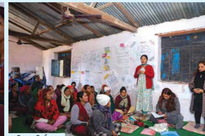
तरिबर : सिर्जना मठ